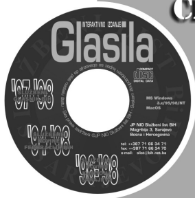
CD '94 - '98